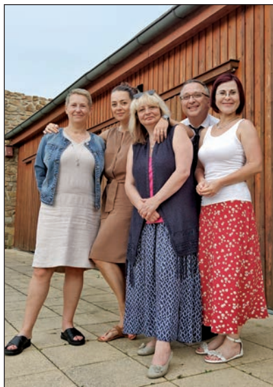
(Vedení APHPP při pracovním červencovém setkání)

16. 9. se uskutečnilo setkání zaměstnanců domácích hospiců v Prachaticích.