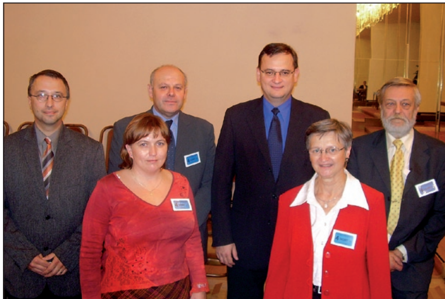
Představenstvo APHPP při jednání s ministrem práce a sociálních věcí RNDr. Petrem Nečasem dne 24. října 2007.