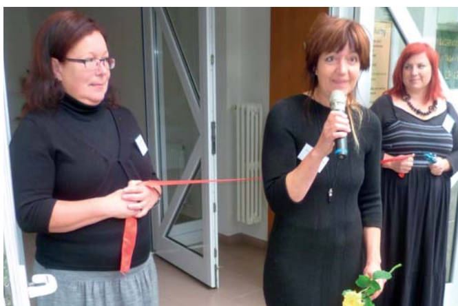
První tři reprezentatky pracoviště ve Velkém Meziříčí

■ Domácí hospicová péče – kterou ve shodě s ostatními jejími poskytovateli definujeme jako sociální a zdravotní péči o umírající klienty v jejich domácím prostředí s cílem odlehčení fyzické i psychické zátěže rodiny, která se doma o terminálně nemocného pacienta stará.