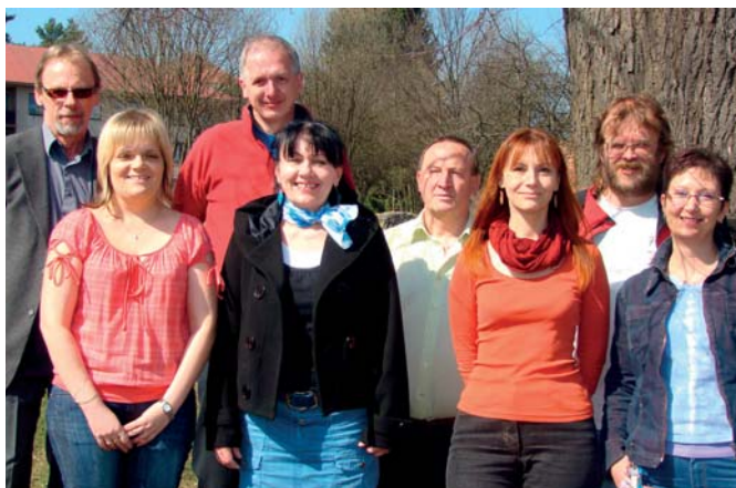
Zaměstnanci DHV u Nového Města na Moravě

Začátkem roku 2000, tedy skoro přesně před 15 lety bylo založeno občanské sdružení Hospicové hnutí, o.s. a pod tímto názvem sdružení fungovalo až do září roku 2013. Tehdy byla zakončena nezbytná transformace, která kromě změny právní formy na obecně prospěšnou společnost přinesla i obměnu názvu na Domácí hospic Vysočina, o.p.s.. Tím ale výčet výrazných změn končí a to hlavní, tedy předmět činnosti se nezměnil a na prvním místě tak už po uvedených 15 let stojí domácí hospicová péče. Průkopnické, přípravné a převážně dobrovolnické práce trvaly až do roku 2005, kdy byly postupně se formujícím týmem poskytnuty první domácí hospicové péče. Úspěch tohoto střediska a zájem o jeho služby vedl tehdejší předsednictvo k rozhodnutí, zřídit další středisko v Jihlavě. A skutečně se tomu tak stalo v roce 2008 a k 1. 7. tak zahájilo činnost naše druhé středisko hospicové péče. Už byly zmíněny dobrovolnické počátky práce tehdejších zakladatelů a je nutno dodat, že dobrovolnictví je takřka nedílnou součástí organizace a konkrétně obou středisek dodnes. Těžko už bychom dopočítávali jejich skutečný počet, ale určitě by byl vyšší než 100 a v současné době jich s námi spolupracuje 35. Nejsou sice zapojeni přímo do hospicové péče, ale jejich práce se seniory v pěti sociálních a zdravotnických zařízeních je určitě neméně prospěšná a důležitá. Dalším důležitým