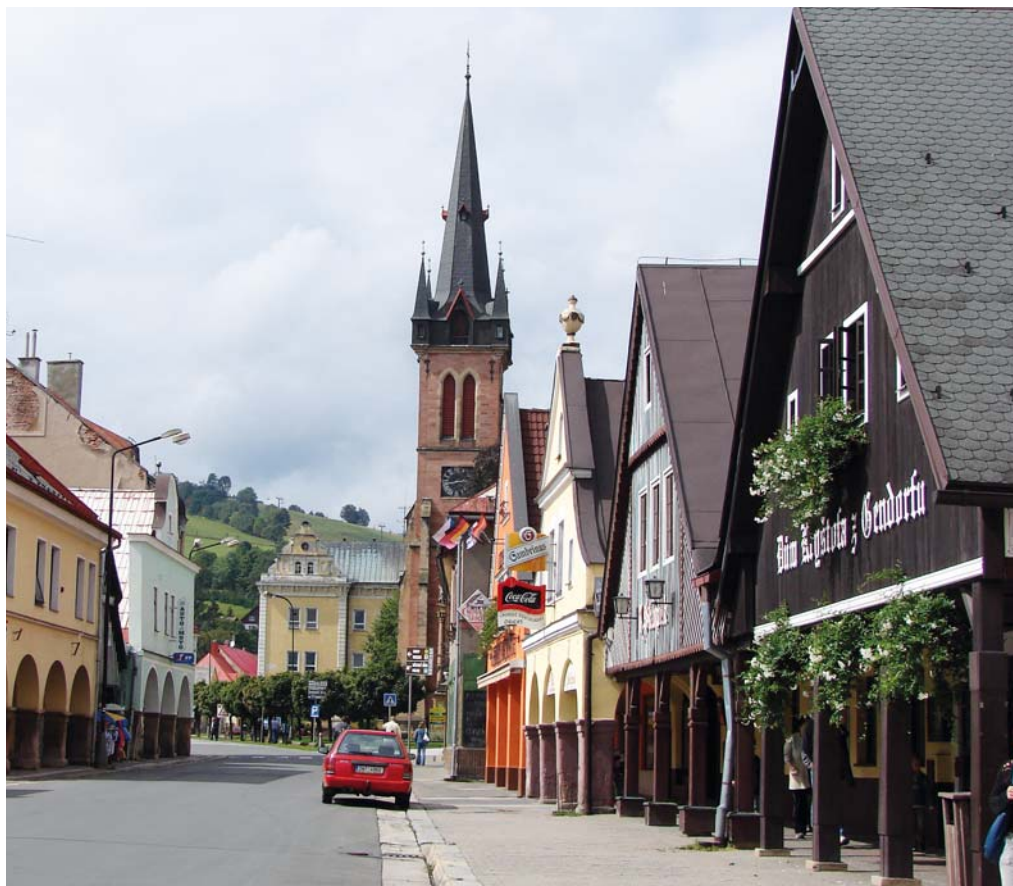
Vrchlabí – průhled Krkonošskou ulicí s kostelem sv. Vavřince.