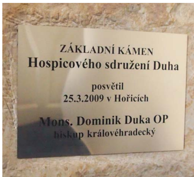
Základní kámen Domácího hospice Duha, o.p.s.

Představte si nemocniční pokoj, kde leží několik lidí. Od sebe jsou odděleni pouze plentami. Každý z nich má před sebou poslední dny života. Nejsou však všichni staří. Některým je přes dvacet, dalším přes třicet. Rakovina si zkrátka nevybírá věk, postavení ani majetkové zázemí. Je jich na pokoji několik, a přesto jsou zde zcela sami. Není zde nikdo, kdo bys nimi přišel pohovořit o životě, něco jim předčítal nebo zkrátka jen dělal společnost. Zdravotní sestry mají své jiné povinnosti. A tak je světem těchto pacientů jen prostor za plentou. Prostor