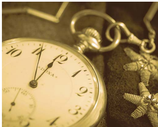
Jedna z vystavených fotografií s příběhem.