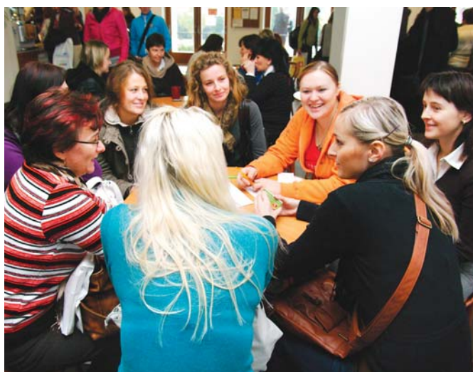
Kuloární diskuse jsou stejně důležité jako ty v plénu...

MNĚ SE TADY TAK LÍBÍ... ALE NIKOMU TO NEŘÍKEJTE, CHTĚLI BY SEM PAK VŠICHNI! PACIENTKA HOSPICE SV. J. N. NEUMANNA V PRACHATICÍCH